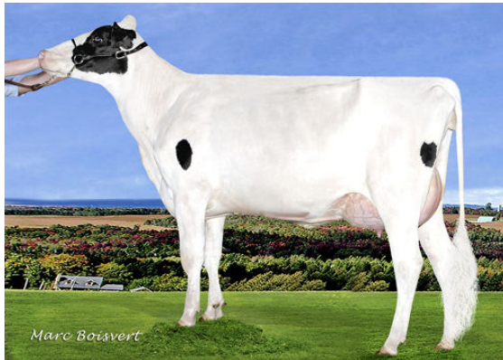
DUDOC MAGNA REQUIEM P FOURTH DAM